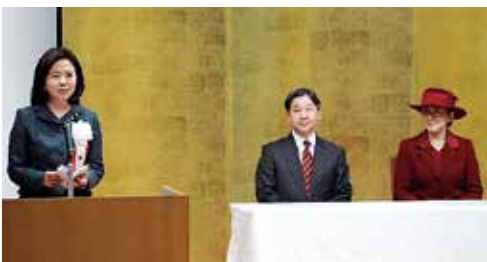
1月22日、天皇皇后両陛下ご臨席のもと、厚生労働省主催の国立障害者リハビリテーションセンターならびに国立職業リハビリテーションセンター創立40周年記念式典にて加藤厚生労働大臣の祝文を代読させていただきました