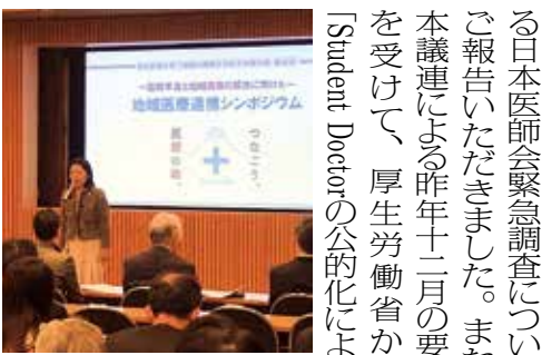
1月31日「地域医療を担う医師の確保を目指す知事の会」でご挨拶の機会をいただきました

「超党派「脳卒中・循環器対策フォローアップ議員連盟」設立総会」の脳卒中・循環器病対策基本法が昨年十二月一日に施行され、厚生労働省に「循環器病対策推進協議会」が設置され、二〇二〇年夏頃を目途に「循環器病対策推進基本計画」が策定されます。そのため、本法の理念をし