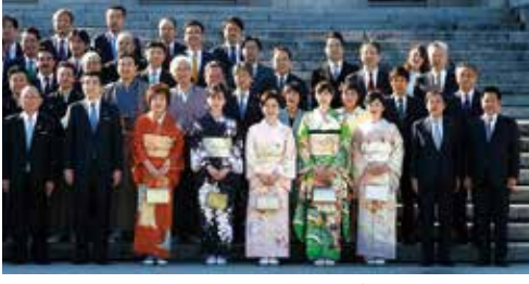
1月20日、第201回通常国会が開会しました

「超党派「脳卒中・循環器対策フォローアップ議員連盟」設立総会」の脳卒中・循環器病対策基本法が昨年十二月一日に施行され、厚生労働省に「循環器病対策推進協議会」が設置され、二〇二〇年夏頃を目途に「循環器病対策推進基本計画」が策定されます。そのため、本法の理念をし