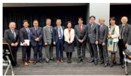
超党派「脳卒中・循環器対策フォローアップ議員連盟」設立総会終了後に記念撮影

きました。今年は、これらの対策を予算措置も含めて実現させていく取り組みや、認知症との関係など、個別のテーマを深掘りするなど、よりいっそう力強い難聴対策に向けて頑張ります。「医師養成の過程から医師偏在是正を求める議員連盟」第7回総会