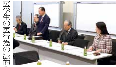
2月6日、「医師養成の過程から医師偏在是正を求める議員連盟」第7回総会にて、河村建夫会長のご挨拶

きました。今年は、これらの対策を予算措置も含めて実現させていく取り組みや、認知症との関係など、個別のテーマを深掘りするなど、よりいっそう力強い難聴対策に向けて頑張ります。「医師養成の過程から医師偏在是正を求める議員連盟」第7回総会