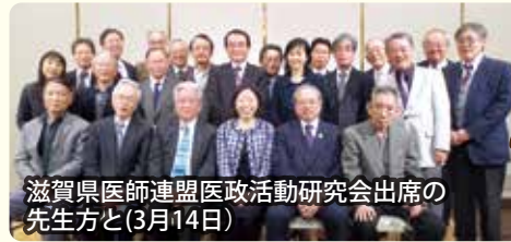
滋賀県医師連盟医政活動研究会出席の先生方と(3月14日)

※4月20日現在(紙面の関係で全ての会合をご紹介できませんことをお許しください)