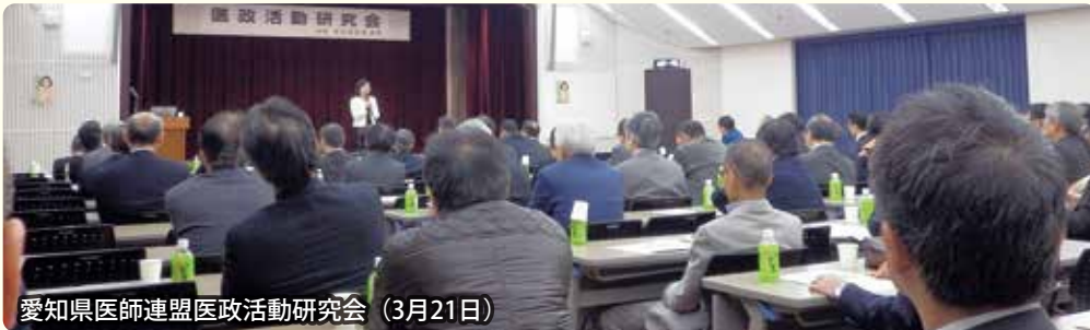
愛知県医師連盟医政活動研究会 (3月21日)