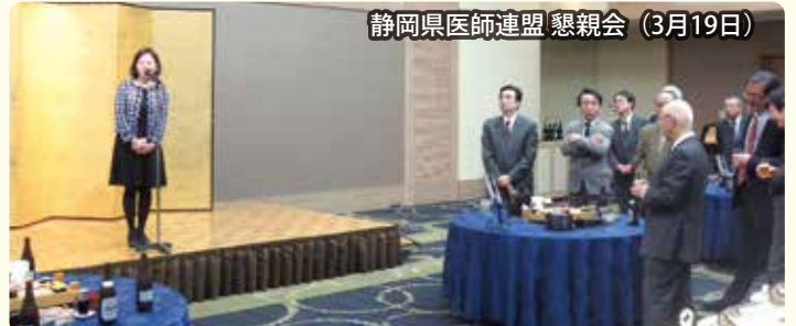
静岡県医師連盟 懇親会 (3月19日)