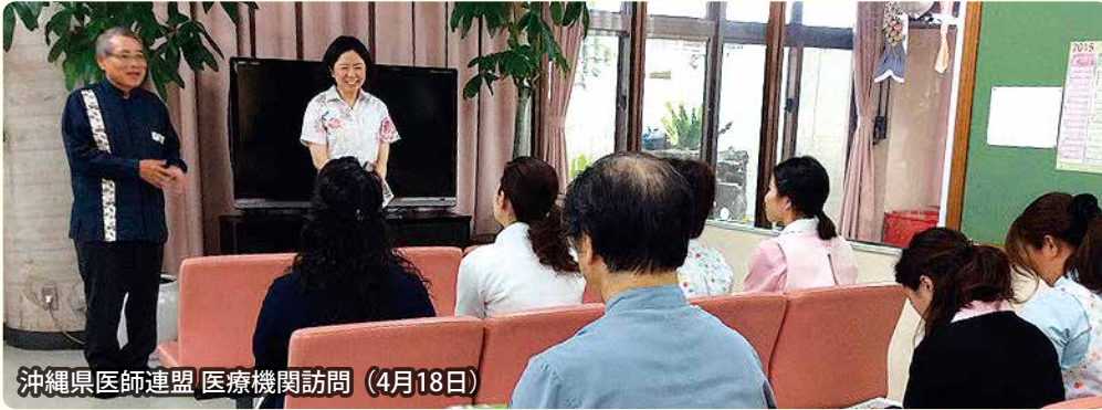
沖縄県医師連盟 医療機関訪問 (4月18日)