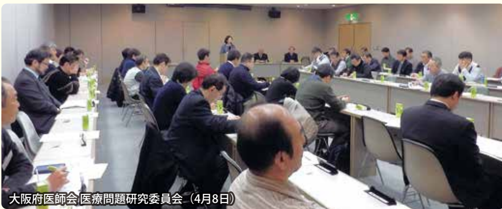
大阪府医師会 医療問題研究委員会 (4月8日)