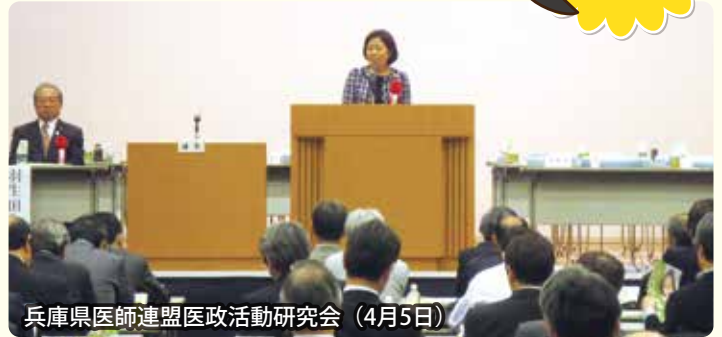
兵庫県医師連盟医政活動研究会 (4月5日)